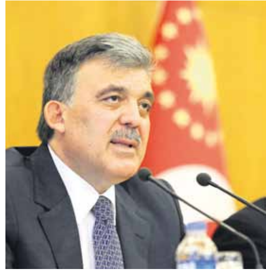
Cumhurbaşkanı Abdullah Gül.

19 EYLÜL 2011 PAZARTESİ WWW.ZAMAN.COM.TR 50 Kr