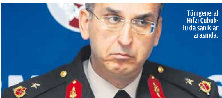
Tümgeneral Hüseyin Keleş'in da sanıklar arasında.