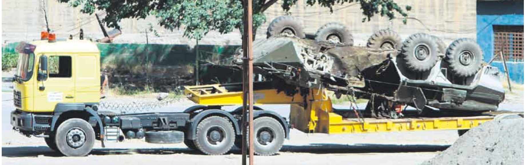
Çukurca'da, 17 Ağustos günü 100 kilo C-4 ve amonyum nitrat kullanılarak yapılan saldırıda zırhlı araç bu hale gelmişti. Mayınlı tuzağın patlaması sonucu, Binbaşı Yavuz Başayar ile birlikte toplam 8 askerimiz şehit düşmüştü.

Güvenli olmayan bölgelere asker sevkiyatı havadan yapılacak Ş06