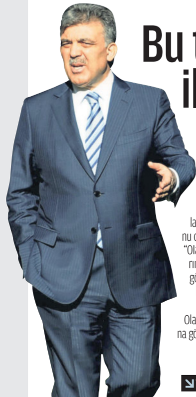
Cumhurbaşkanı Abdullah Gül

BM'nin Mavi Marmara raporuna Cumhurbaşkanı Abdullah Gül'den sert tepki geldi. Cuma namazı çıkışında gazetecilerin sorularını cevaplayan Gül, "Rapor, açıklası bizim için yok hükmündedir." dedi. Dışişleri Bakanı Davutoğlu'nun açıklamalarının, Türkiye devletinin pozisyonu olduğunu vurgulayan Cumhurbaşkanı, "Olayların unutulmadığını ve vatandaşlarımızın hak ve hukukunun korunacağını göstermek açısından devletimizin kararlılığını bazılarını belki anlayamamışlardır. Alınan tedbirler bunun ilk aşamasıdır. Olayların seyrine göre, İsrail'in davranışına göre daha ileride alınacak başka tedbirler de söz konusu olabilir." dedi. DIŞ HABERLER 12